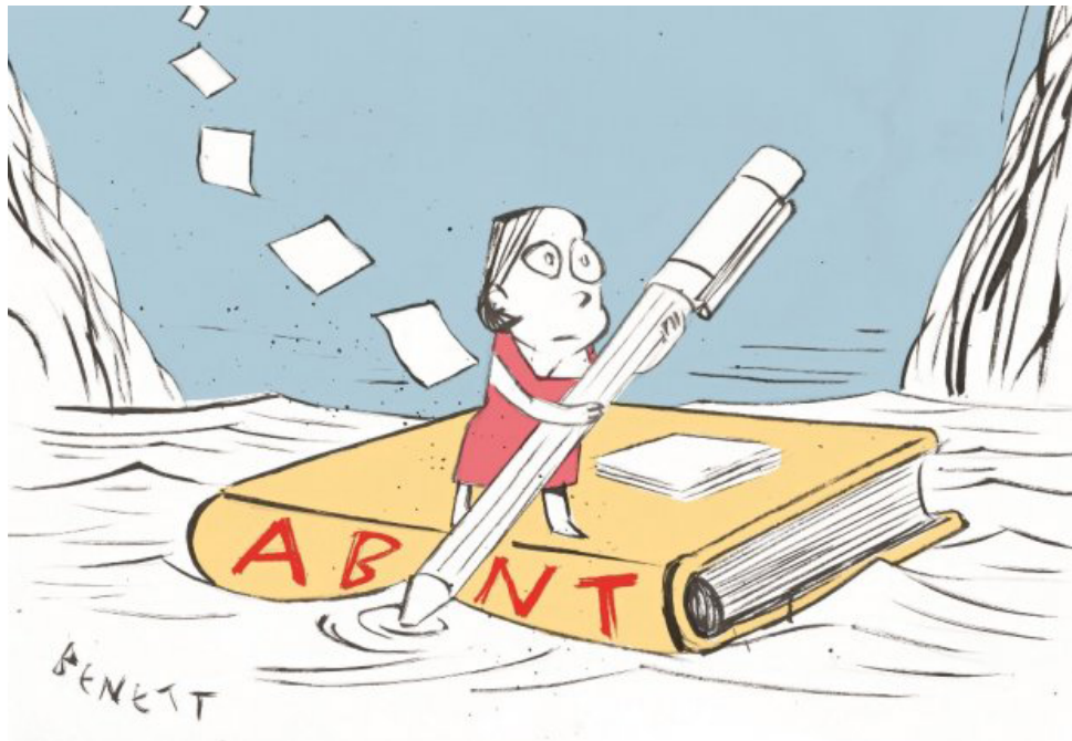
Figura 2 – Exemplo de figura