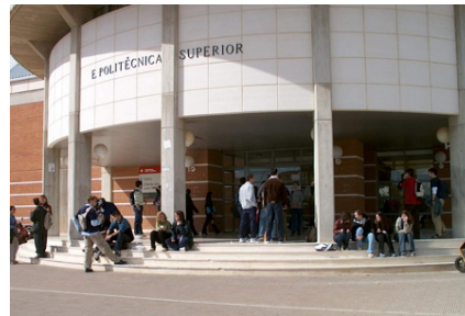
(b) Fotografía de la derecha