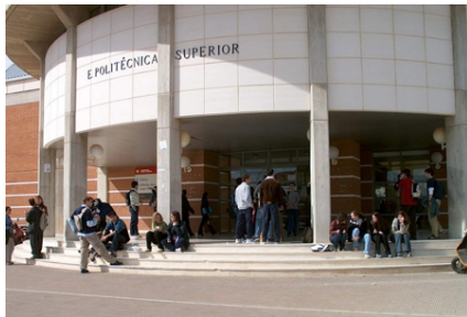
(a) Fotografía de la izquierda

Se incluye el paquete subfigure para la inclusión de figuras con varias imágenes o gráficas, como la que muestra la figura 2.3.