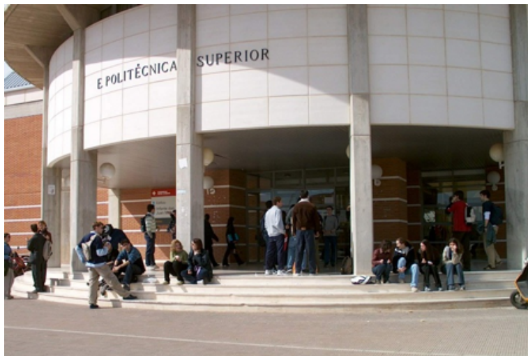
Figura 2.2: Escuela Superior de Ingeniería Informática. Esto es un texto descriptivo algo más largo que puede producir un efecto feo.