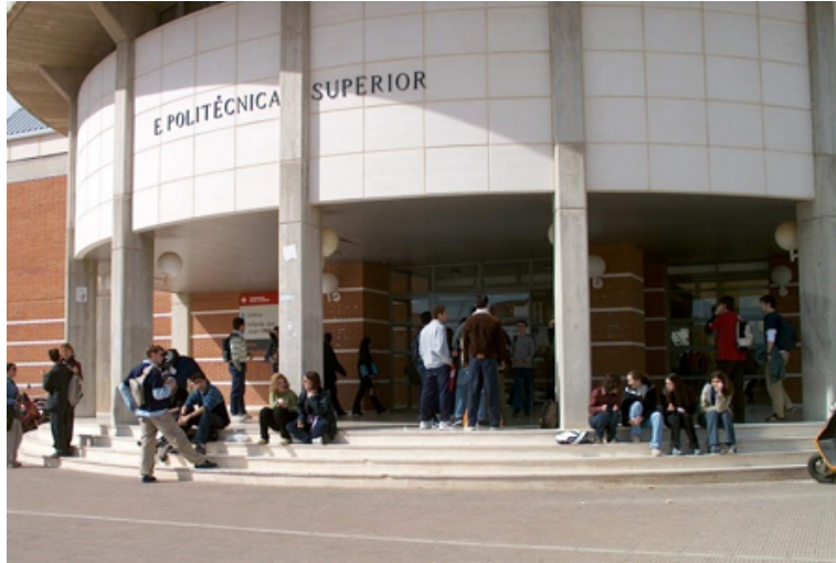
Figura 2.1: Escuela Superior de Ingeniería Informática. Esto es un texto descriptivo algo más largo que puede producir un efecto feo.