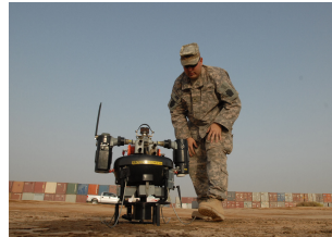
FIGURE 1.2 – Exemple d’image au format JPG.